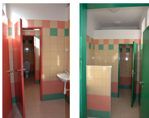
toalety - dívčí a chlapecké